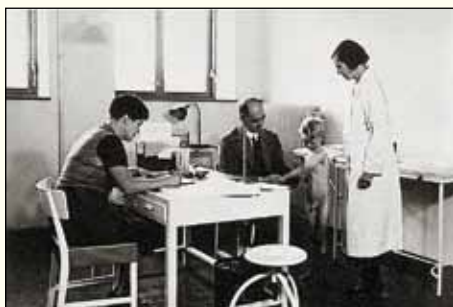
En tur hos skolelægen.