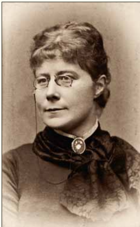
Nielsine Nielsen (1850-1916). Første kvinde til at bryde mænds monopol på højere uddannelse ved at få adgang til Københavns Universitet i 1875 og ti år senere blive den første kvindelige læge.