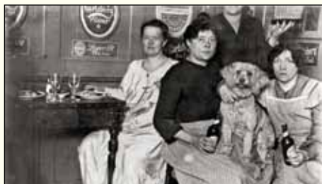
Nielsine Nielsen får stor betydning for Københavns prostituerede, da hun udnævnes til kommunal venerolog i 1906.

Udadtil er Nielsine Nielsen altid behersket og rolig, men i sine erindringer giver hun frit løb for de urimeligheder og fordomme, hun havde mødt som en af sin tids kvindelige pionérer.