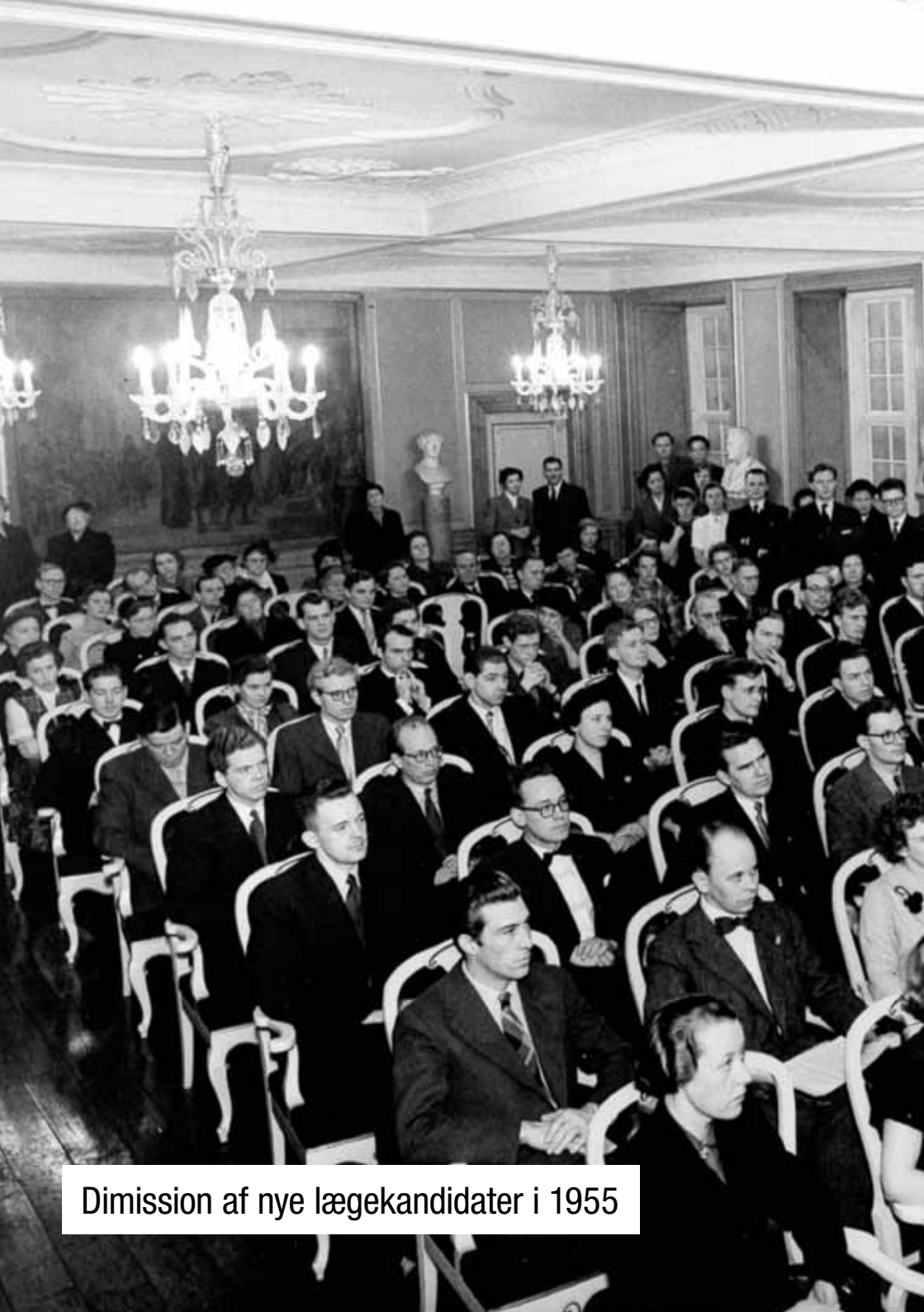
Dimission af nye lægekandidater i 1955